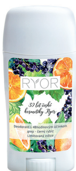
Deodorant grep - černý rybíz, 151 Kč