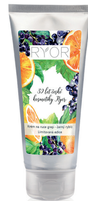
Krém na ruce grep - černý rybíz, 120 Kč